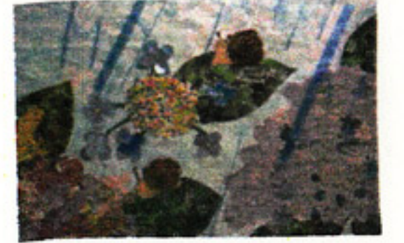
5月に作成した "あじさい"の貼り絵です。