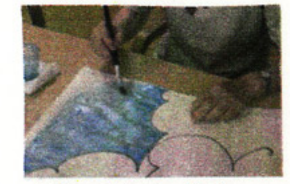
時には絵の具で色塗り...