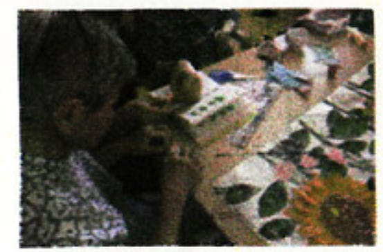
"セシ"は 折り紙を折ったものを 貼りました!!