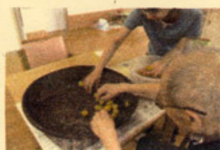
塩につけておいた梅を取りだして干します。

6月中旬から挑戦している梅干し作り。 さてさて、その後の様子は...?! 今回は紅じそをつける様子をご紹介します。