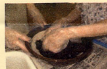
紅じその葉を手洗い 洗い、みじもみします。