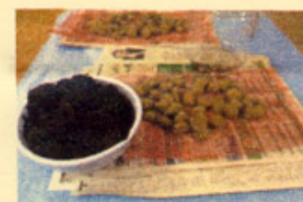
さあ! 梅と紅じその 準備が整いました!!