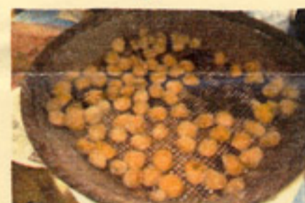
雨にあてないようにつけ... 干した梅です。