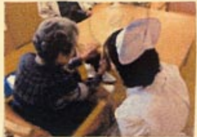
看護師による健康チェック 体調面が不安がある時には 気軽に相談していただけます

今回は、デイサービスでの1日の様子に加え、先月実施した外出の様子をご紹介します。