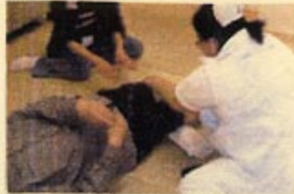
おひとりおひとりに合わせた 個別リハビリ